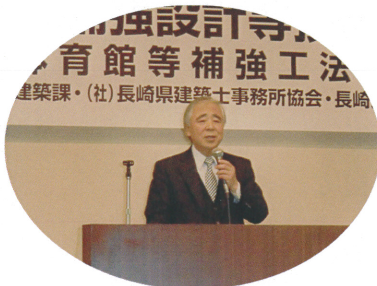
講師：長崎県建築鉄骨研究会 専門委員会 高比良委員長